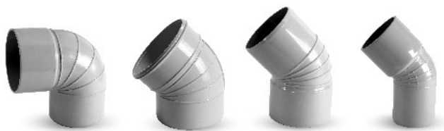
اتصالات فاضلابی چسبی - زانو