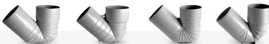
اتصالات فاضلابی چسبی - سیفون