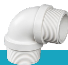
زانو نر رزوه‌ای U-PVC