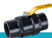
شیر توپی دو ضرب دسته فلزی با توپی بدون آبکاری