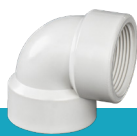
زانو ماده رزوه‌ای U-PVC