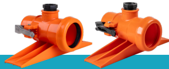
کد گروه محصول: ۴۳۱۷۳