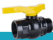
شیر توپی تک ضرب دسته پلیمری یک سر نر یک سر ماده