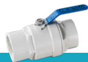
شیر توپی پرو وایت دسته فلزی با توپی بدون آبکاری