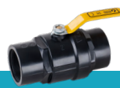
شیر توپی دو ضرب دسته فلزی با توپی آبکاری