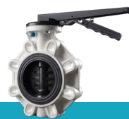
شیر پروانه‌ای پلیمری با دسته فلزی